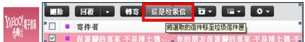
設定過濾垃圾郵件圖示（畫面來源：Gmail 與 Yahoo!奇摩信箱 / 製圖：NII 產業發展協進會）