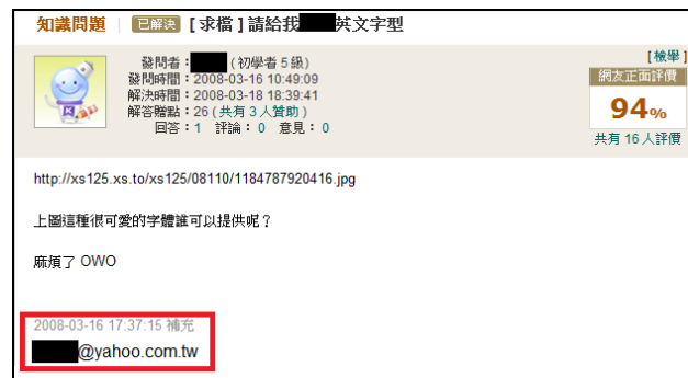
網路討論區發文示意

很多人喜歡在網路討論區或論壇中，跟網友互動或索取檔案，常在公開網頁 PO 文留下例如「誰可以提供我檔案，我的 e-mail 是.....」的內容，垃圾郵件傳播者最愛利用程式工具大肆搜括這些資訊拿來利用喔！